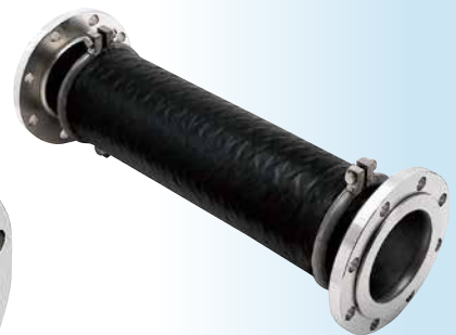
Z-7000MS (埋設用/Lay underground)