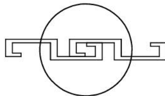
A部詳細 detail A