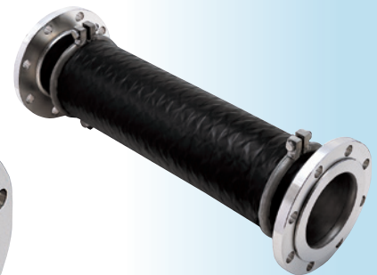
Z-7000MS (埋設用/Lay underground)