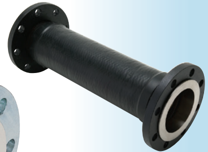
Z-4000MS (埋設用/Lay underground)