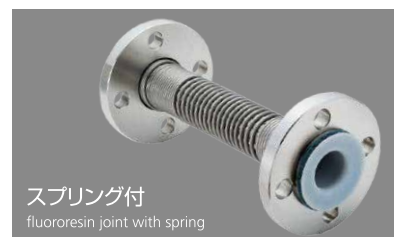
スプリング付 fluororesin joint with spring