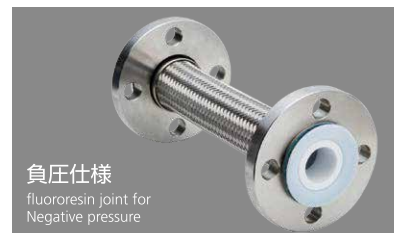
負圧仕様 fluororesin joint for Negative pressure