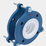
ZTF-5000 (フッ素樹脂製防振継手) ZTF-5000 Fluororesin polymer vibration absorber