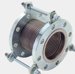
A·V·JOINT (SUS製防振継手) A·V·JOINT Stainless steel vibration absorber