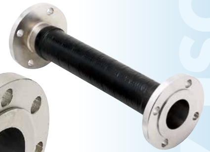
Z-5000MS (埋設用/Lay underground)

※SUS316L製ベローズの製作可能 ※350Aも製作可能 ※SUS316L bellows is also available. ※350A is also available